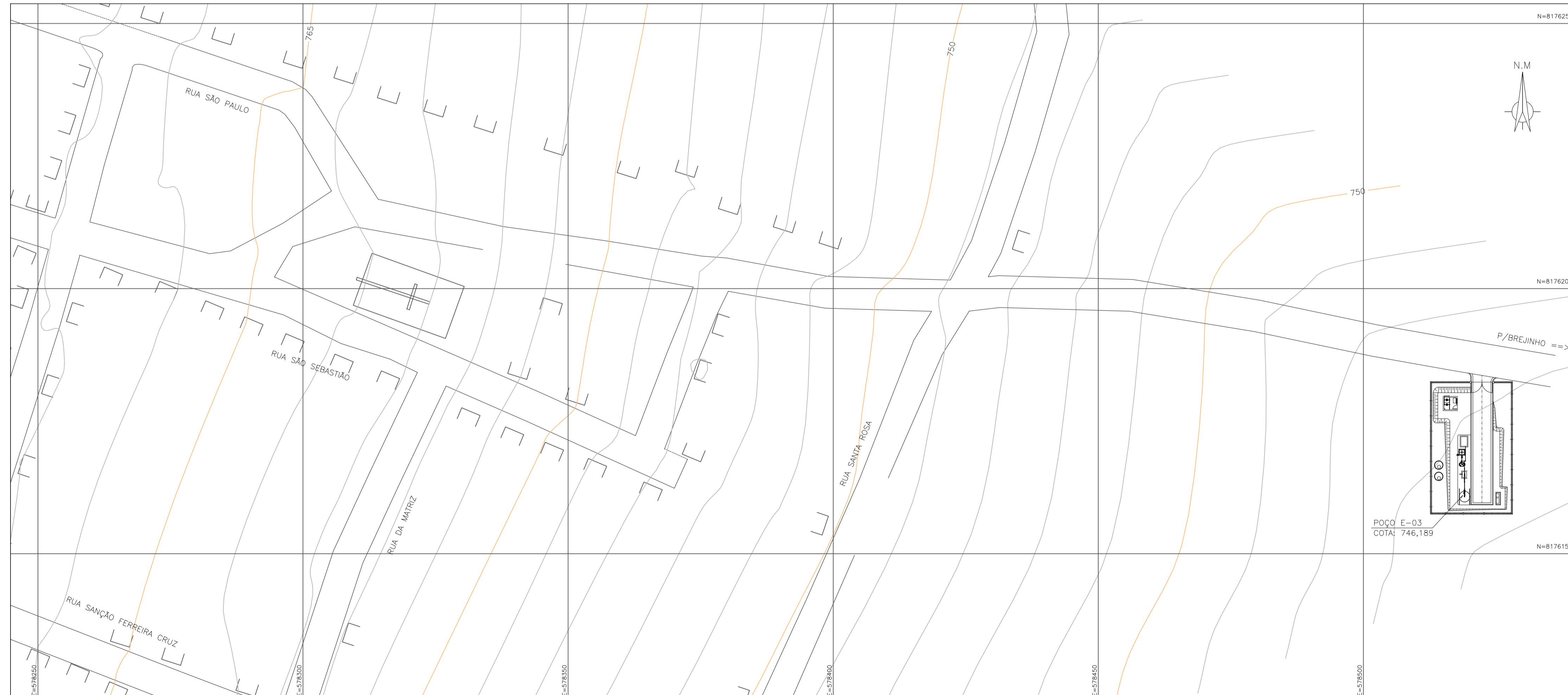
PLANTA DE SITUAÇÃO ESC.: 1:500